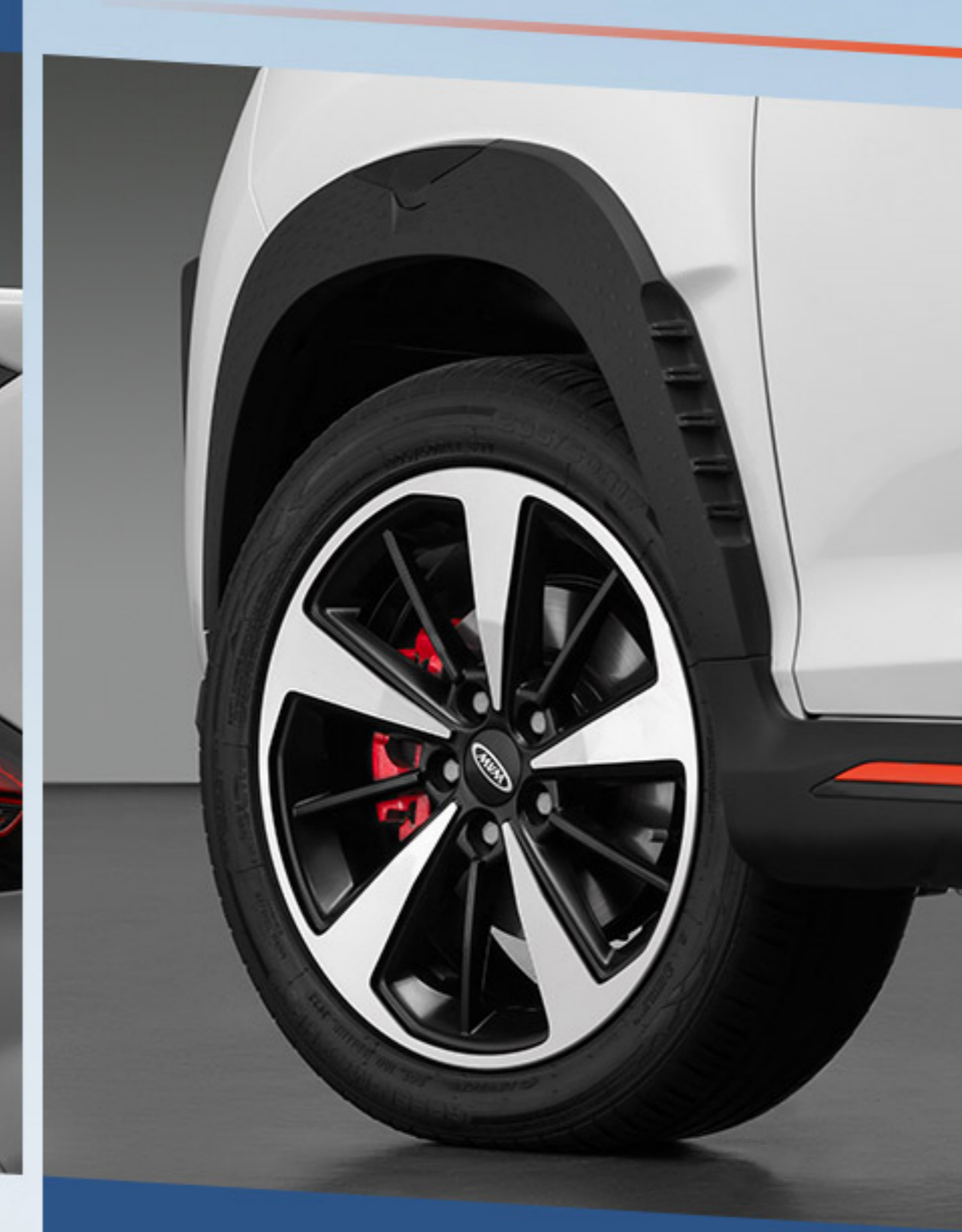
رینگ ۱۷ اینچ آلومینیومی