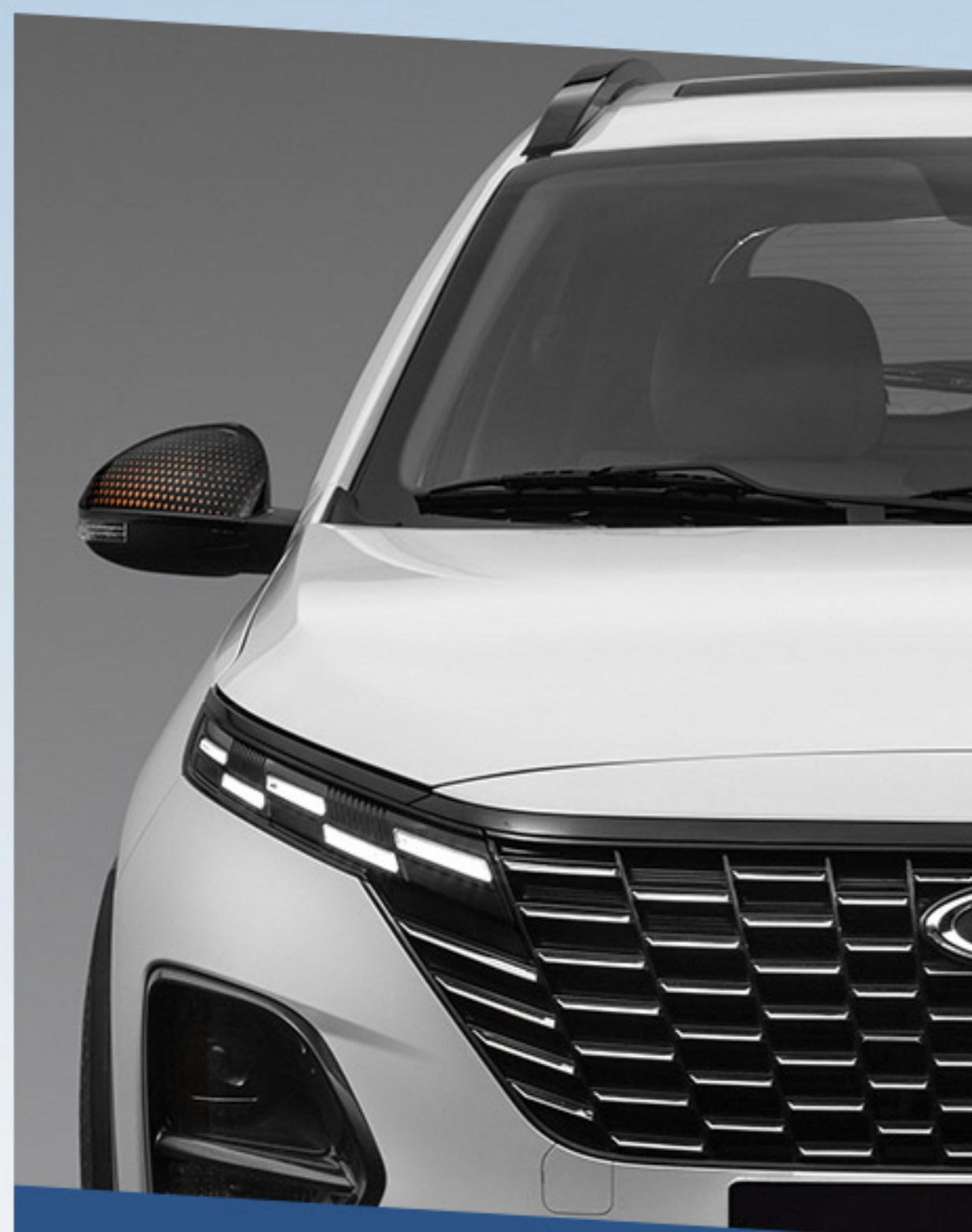
جلو پنجره کوانتومی